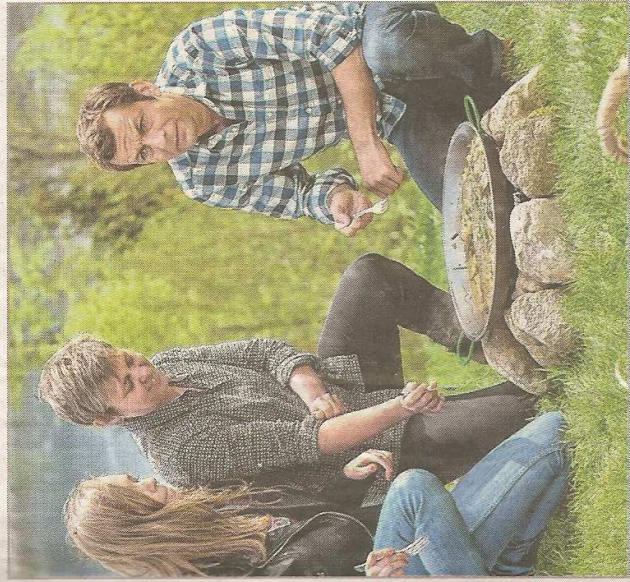
Fidèle à ses habitudes, le Vosgien Laurent Mariotte a souhaité faire la promotion des produits locaux.

Recette du jour : matelote de truite au gris de Toul, morilles et safran... de Plombières s'il vous plaît. Le poisson crépite dans le beurre moussoux, les effluves de champignons mêlés aux échalotes embaument l'atmosphère. « La encou- re je fais la cuisine avec des